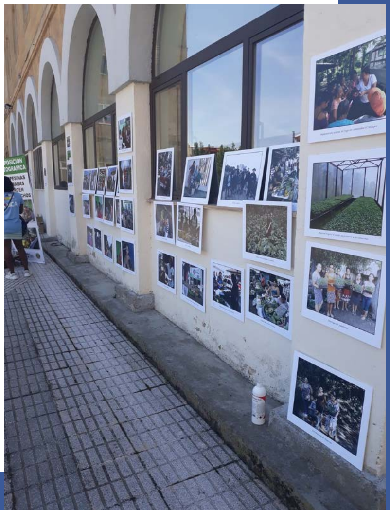
Exposición en Salamanca.

El papel utilizado es metalizado de luxe para dotar a la imagen de una mayor calidad, relieve y expresión artística.