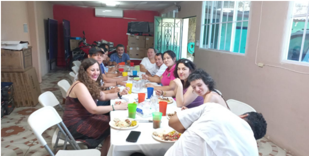
Comida en familia COREDES - TSM.

Durante su visita, las representantes de "Tierra Sin Males" tuvieron la oportunidad de interactuar directamente con las mujeres beneficiarias de los proyectos, quienes han estado trabajando en el desarrollo de prácticas agroecológicas sostenibles para mejorar la seguridad alimentaria y la resiliencia de sus comunidades. Esta experiencia permitió a la presidenta y la secretaria de la ONG comprender mejor las realidades locales y las necesidades específicas de las mujeres involucradas en los proyectos, proporcionando valiosos insights para futuras intervenciones y estrategias de la organización.