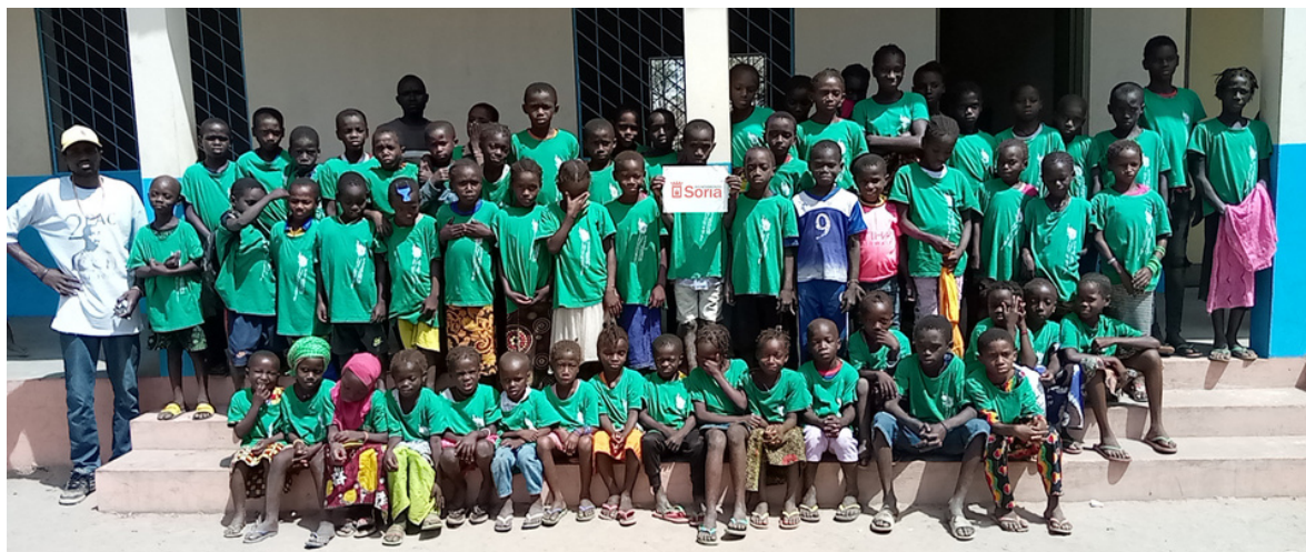
Alumnos y alumnas de la escuela de Mansalia. 1º Clase.

Beneficiaria: Población de Mansalia. Apoyo a 333 personas.