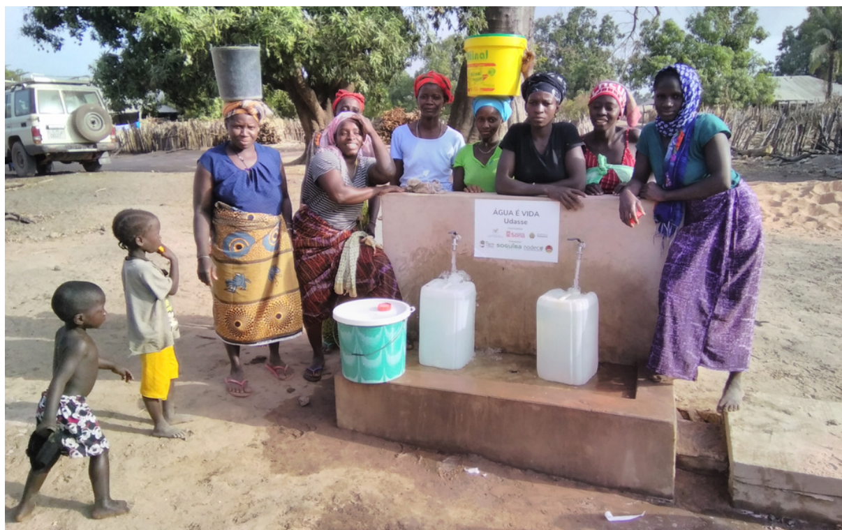
Pozo de Udasse.

Beneficiaria: Población de Udasse. Apoyo a 1027 persona.