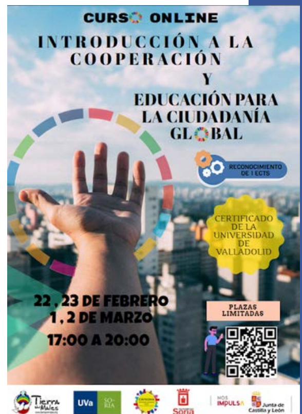
Cartel del curso.

Al concluir, de los 27 participantes, 17 de ellos obtuvieron un certificado emitido por la Cátedra Agenda Urbana 2030 para el desarrollo local de la Universidad de Valladolid. Además, se ofreció la posibilidad de solicitar 1 crédito de libre configuración por otras actividades de la universidad. Se cumplieron exitosamente sus objetivos, contribuyendo a la formación de ciudadanos comprometidos con la transformación social.