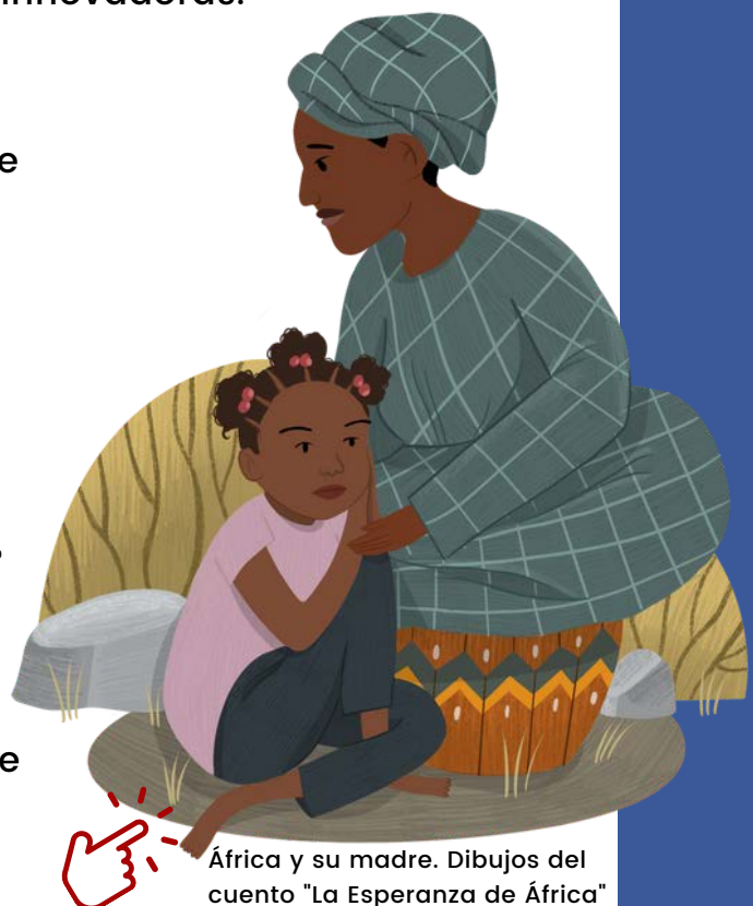
África y su madre. Dibujos del cuento "La Esperanza de África"

El proyecto culminó con la creación de un libro, materiales didácticos por parte de las escuelas españolas para los colegios en Bigene, apoyados por un equipo multidisciplinario de Tierra Sin Males y la Universidad de Valladolid. Este intercambio brindó a los docentes de Bigene nuevas metodologías y materiales para emplear en sus clases, permitiendo que sus estudiantes también conocieran la realidad de España. Este exitoso proyecto piloto se propone ser iterado y mejorado en base a las valiosas aportaciones recogidas durante su ejecución.