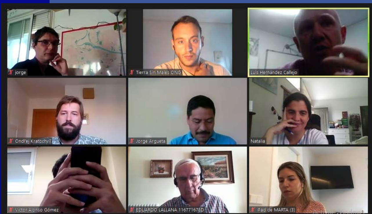
Reunión con la OTC de El Salvador para el proyecto de Innovación de la AECID.