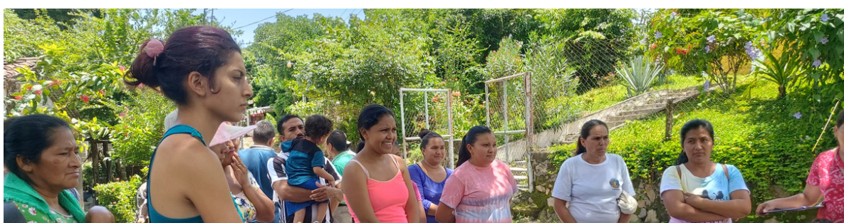
Mujeres recibiendo formación comunitaria.

El proyecto beneficiará a más de mil personas directamente y a casi 1.066 ciudadanos de la región. Se espera que, como resultado, mejoren las prácticas de producción de alimentos, se diversifique la dieta y mejore la nutrición de las familias. También se pretende que se refuerce la participación social y económica de las mujeres y las organizaciones locales y que el Gobierno municipal de Suchitoto implique políticas públicas para garantizar el derecho a la alimentación a nivel local.