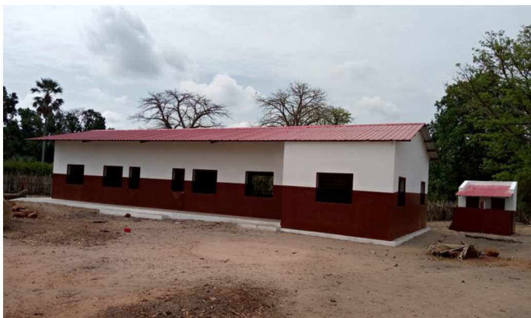
Escuela de Udasse.

Coste total: 67.500 euros, 35.145 Ayto.Soria, 10.212 Ayto.Vallad Ayto. Beneficiaria: Población de Udasse. Apoyo a 316 persona.