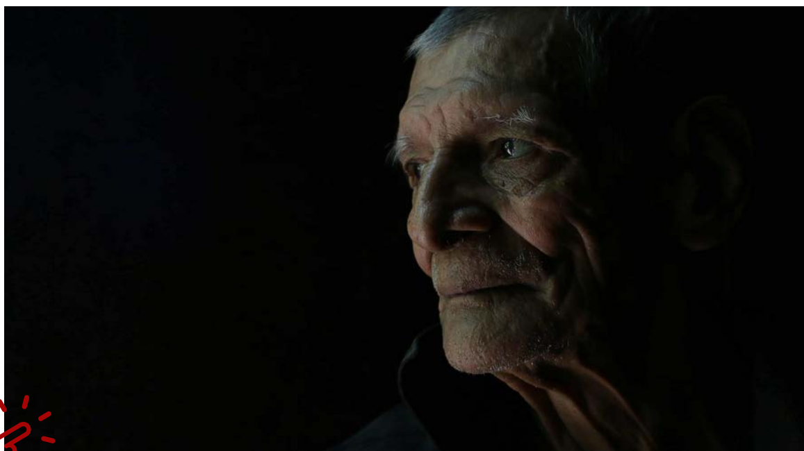
Uno de los hombres del proyecto Descartados.