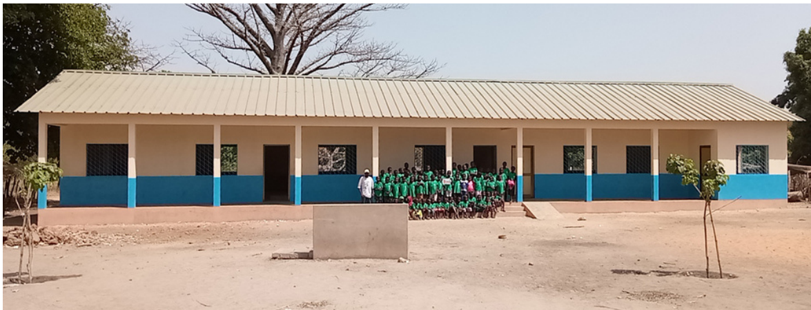
Escuela de Mansalia.