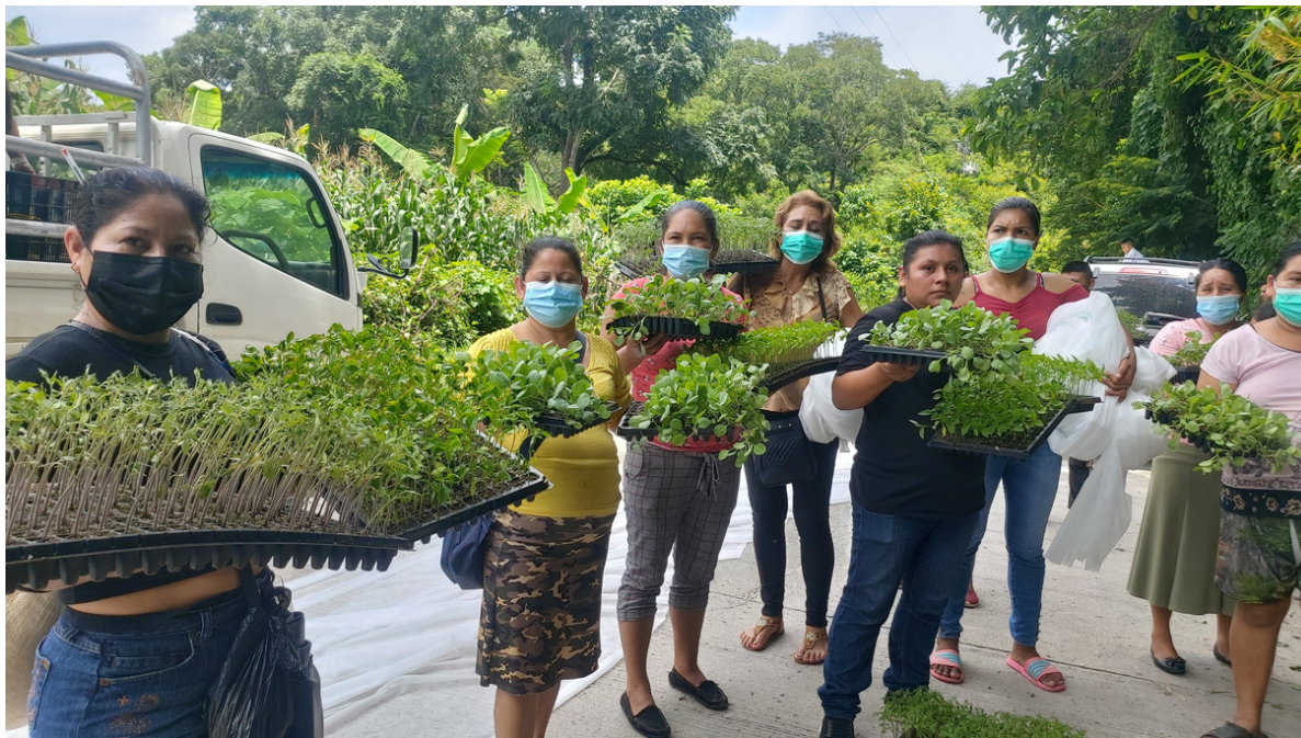
Mujeres recibiendo plantines.

Beneficiaria: 117 mujeres y sus familias, y 52 hombres, en total 169 personas y sus familias, en total 1.066 personas.