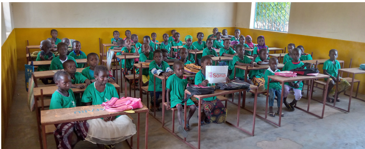
Aulas de la escuela de Mansalia. 1º Clase.