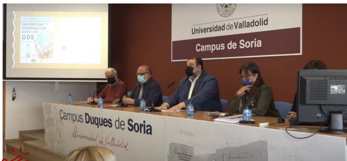
Acto de inauguración de las II Jornadas de Universidad y Cooperación ante los ODS.

El programa de actividades incluyó charlas informativas, presentaciones de experiencias de cooperación al desarrollo, conferencias y actividades en diferentes centros universitarios que se llevaron a cabo del 21 al 25 de marzo. Se trataron diversos temas como la Responsabilidad Social Universitaria ante la Agenda 2030, proyectos educativos, la experiencia de la ONG AIDA en Guinea Bissau, proyectos de suministro y potabilización del agua con energía fotovoltaica en El Salvador, entre otros.