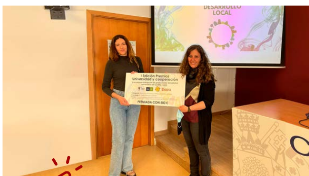
Entrega a los premiados de un cheque por valor 500 euros.

De entre las más 30 solicitudes, se otorgaron dos premios, uno por cada categoría, con una dotación de 500 euros cada uno. Las categorías fueron Derechos Humanos y Perspectiva de Género, y Objetivos de Desarrollo Sostenible y Agenda Urbana.