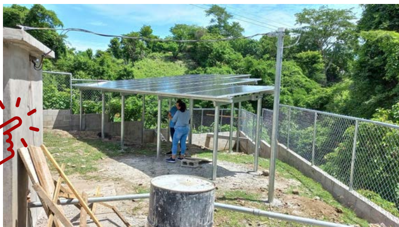
Paneles Solares de la instalación.

Beneficiaria: Cuatro comunidades de Jutiapa, en total 160 familias, en total más de 600 personas.