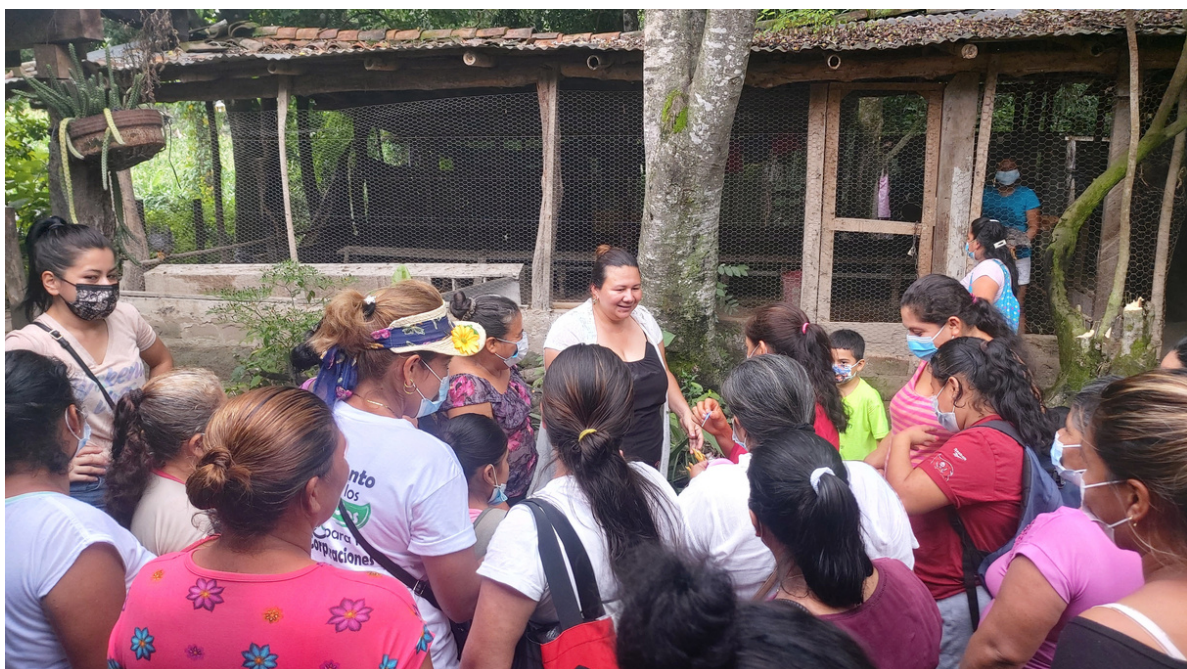
Mujeres recibiendo formación en manejo de aves.