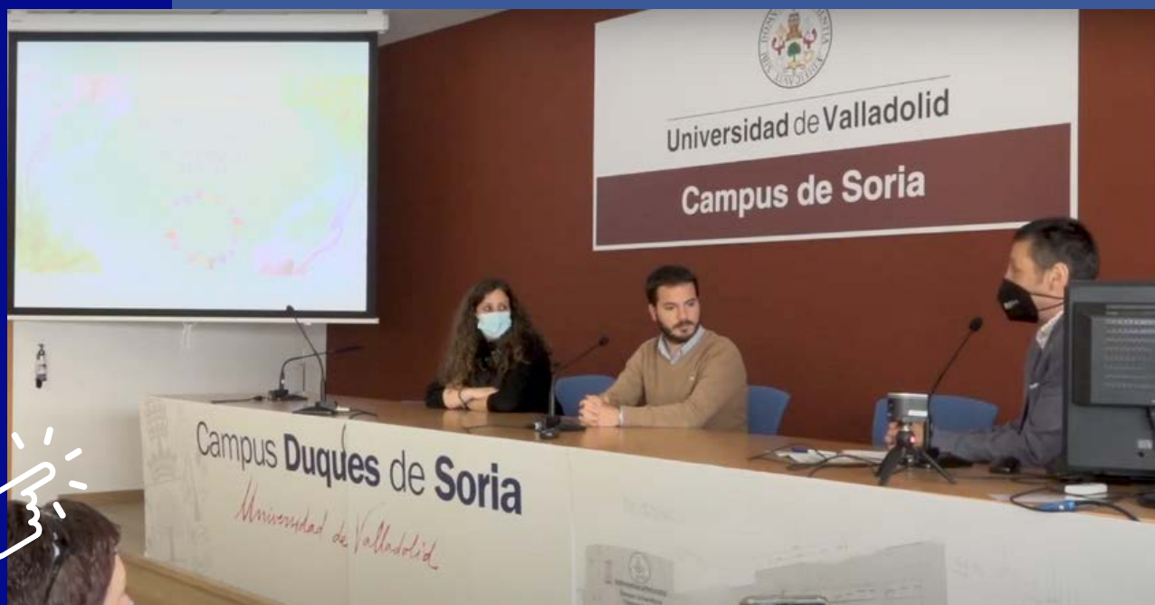
Acto de clausura de las II Jornadas de Universidad y Cooperación ante los ODS.

Tierra Sin Males trabaja por la erradicación de la pobreza y sus causas en el mundo, por una sociedad más justa, igualitaria y solidaria, donde la persona sea el centro, potenciando el humanismo y los valores éticos, facilitando estructuras de comunicación Norte-Sur y promoviendo el desarrollo humano y sostenible de personas y pueblos con proyectos de desarrollo integral, sensibilización e interculturalidad, potenciando el empoderamiento y la integración activa de personas y grupos más vulnerables.