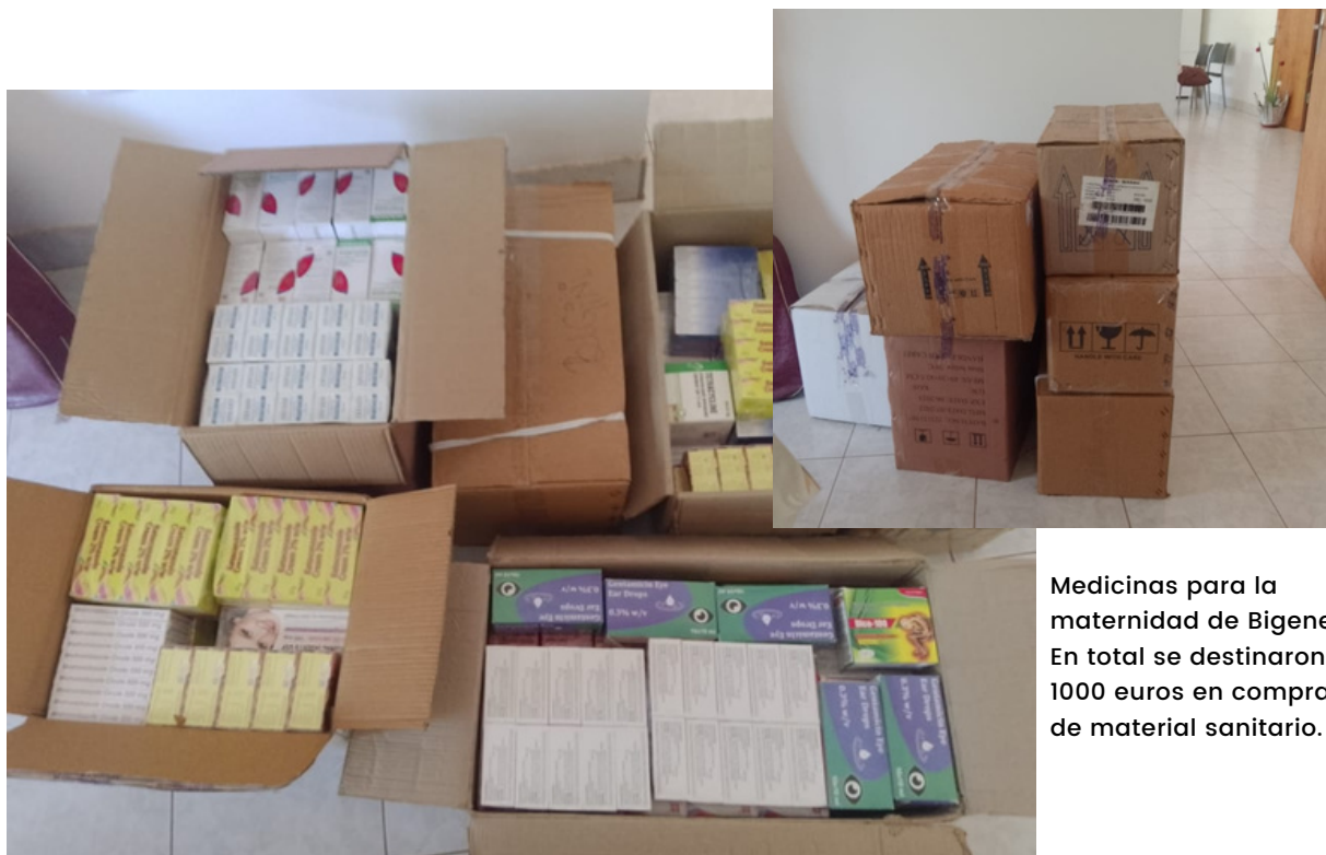
Medicinas para la maternidad de Bigene. En total se destinaron 1000 euros en compra de material sanitario.